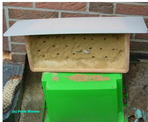
Lehmnistwand mit Auswurfhalden der Frühlings-Pelzbiene.

Eine Reihe von Wildbienenarten bauen ihre Brutnester in Lehmwände. Da Lehm in unseren Gärten meistens Mangelware ist und andere Nistmöglichkeiten in unserer heutigen ausgeräumten Landschaft oft fehlen (z.B. Gemäuer mit Lehmfugen, Abbruchkanten, Steilwände), habe ich für diese und andere steilwandnistenden Wildbienenarten zwei Lehmnistwände hergestellt. Sie wurden sofort nach dem Aufstellen von der Frühlings-Pelzbiene besiedelt. Auch die Gewöhnliche Trauerbiene ( Melecta albifrons ), der Brutparasit der Frühlings-Pelzbiene, ist hier eingezogen. Sie lebt auf Kosten ihres Wirtes - das ist nun mal die Ökologie der Wildbienen.