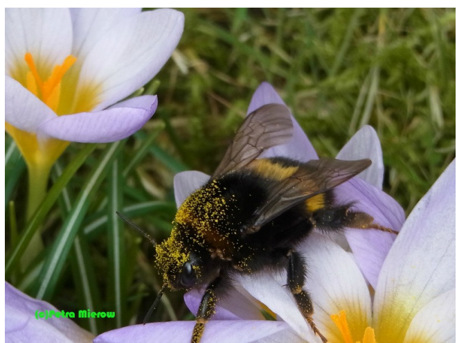
...wie auch die Königin der Dunklen Erdhummel (Bombus terrestris).