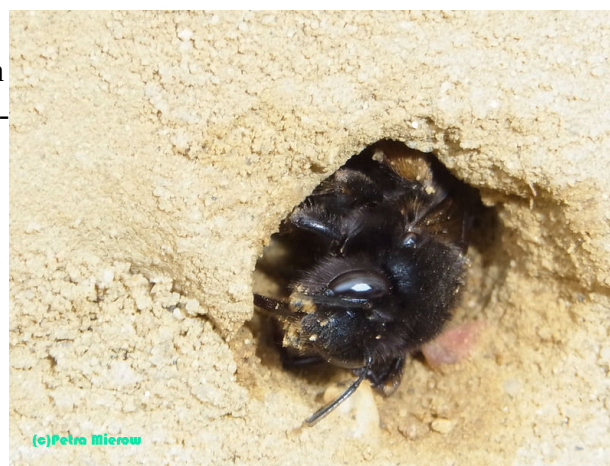
Ein Weibchen der Frühlings-Pelzbiene (dunkle Variante) erweitert seine Brutröhre.

Beim Bau meiner Lehmnistwand habe ich feuchten Lehm verarbeitet, den ich geschenkt bekommen habe. Man kann aber auch feinen Lehm-Oberputz von Fa. Claytec ( www.claytec.de ) verwenden. Eventuell muss er noch mit feinem Sand abgemagert werden, um ihn für die Bienen grabbar zu machen. Dazu habe ich Spielsand von OBI benutzt. Stroh, Schilf oder Steine darf der Lehm nicht enthalten, weil die Grabetätigkeit der Bienen sonst behindert wird. Um das richtige Lehm/Sand- Mischungsverhältnis zu finden, sollte man einige Proben herstellen. Dazu formt man einige Lehm-Bällchen in unterschiedlichen Lehm/Sand-Mischungsverhältnissen (oder auch Lehm-Oberputz pur) und legt sie an einen trockenen, gut durchlüfteten Ort in den Schatten. (Nicht vergessen, die Mischungsverhältnisse zu notieren).