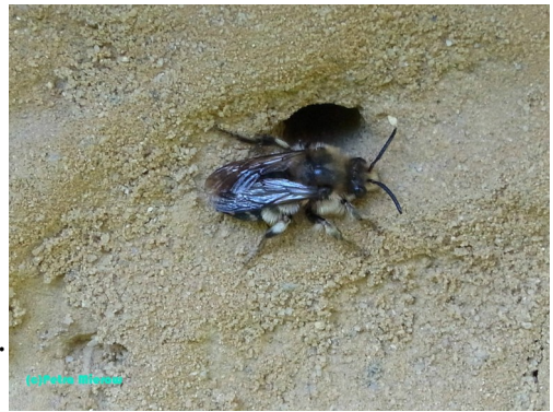
Ihr Brutparasit, die Gewöhnliche Trauerbiene (Männchen).

Zusätzlich zur Nistwand sollte man auch an das Futter für die Wildbienen denken und entsprechende Blumen pflanzen. Im Frühjahr sind es die Krokusse, die erste Nahrung bieten.